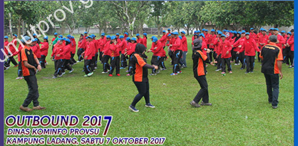
OUTBOUND 2017 DINAS KOMINFO PROVSU KAMPUNG LADANG, SABTU 7 OKTOBER 2017