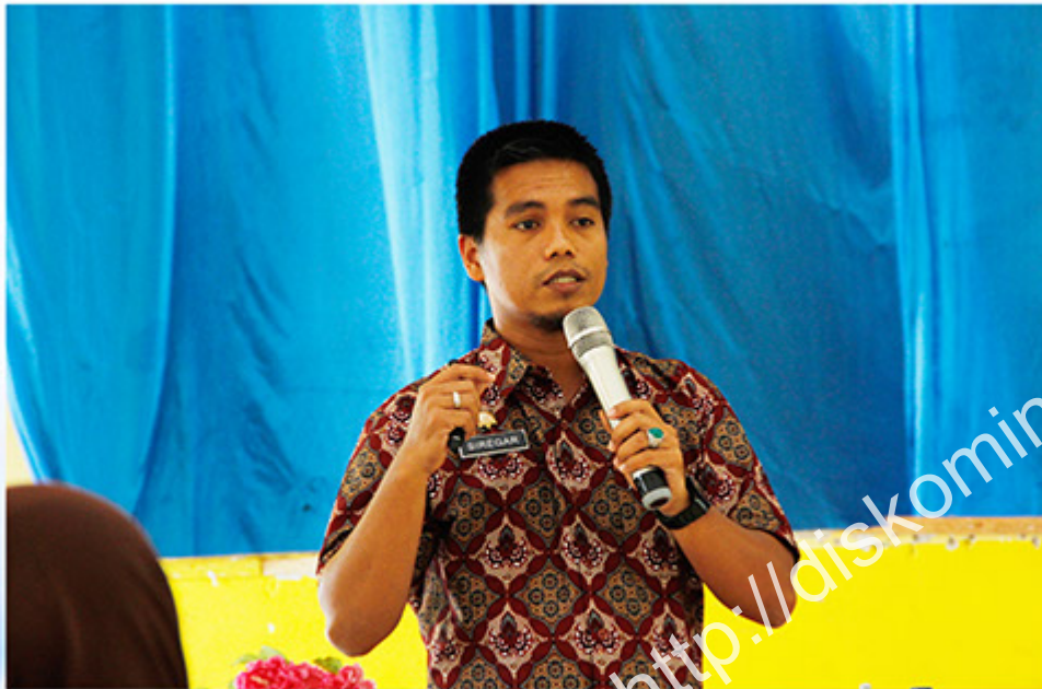
KEPALA SEKSI LAYANAN INFORMASI PUBLIK DISKOMINFO PROVINSI SUMATERA UTARA Rapat Koordinasi Pejabat Pengelola Informasi dan Dokumentasi (PPID) Kota Padang Sidempuan Aula SPMA Kota Padang Sidempuan, Kamis 21 Desember 2017