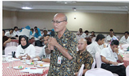
Pilkada Provinsi Dilaksanakan Bulan Juni 2018

Medan, Pemerintah Provinsi Sumatera Utara melalui Dinas Komunikasi dan Informatika Provinsi Sumatera Utara (Dikominfo Provsu) menyelenggarakan Pertemuan Kominfo Humas Kabupaten/Kota se-Sumatera Utara bertempat di Hotel Madani Medan, Rabu (11/10).