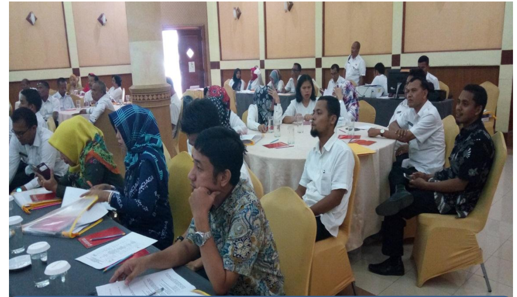
Peserta dengan tekun mendengarkan paparan dari para Nara sumber dari