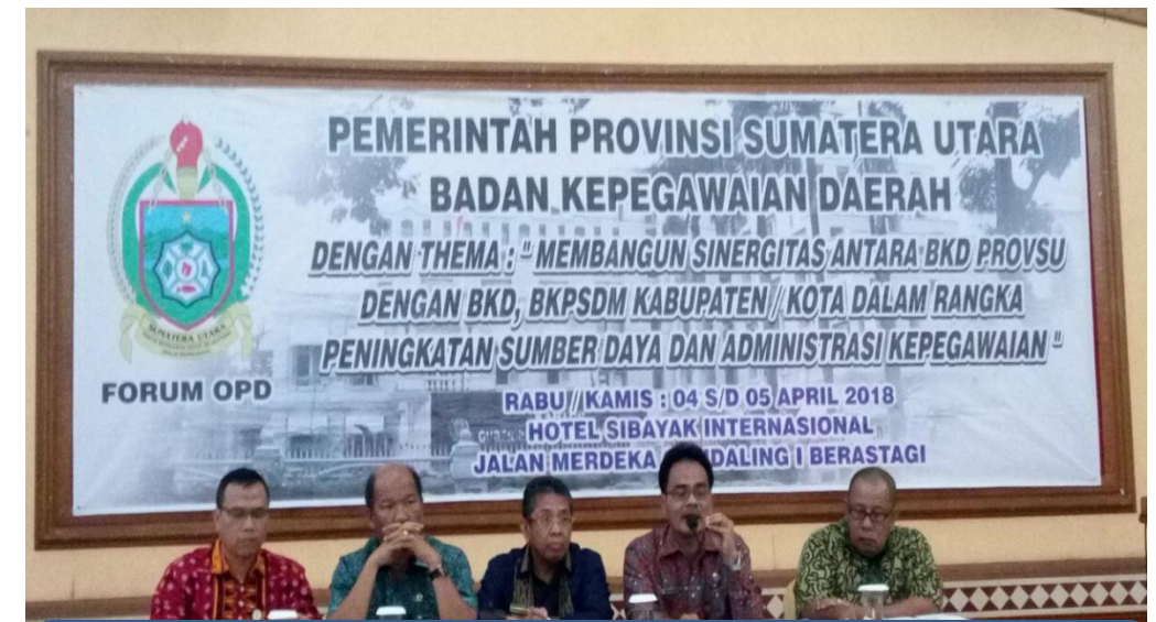
Hari ke II : Nara Sumber dari Para Kepala Bidang BKD Provsu.