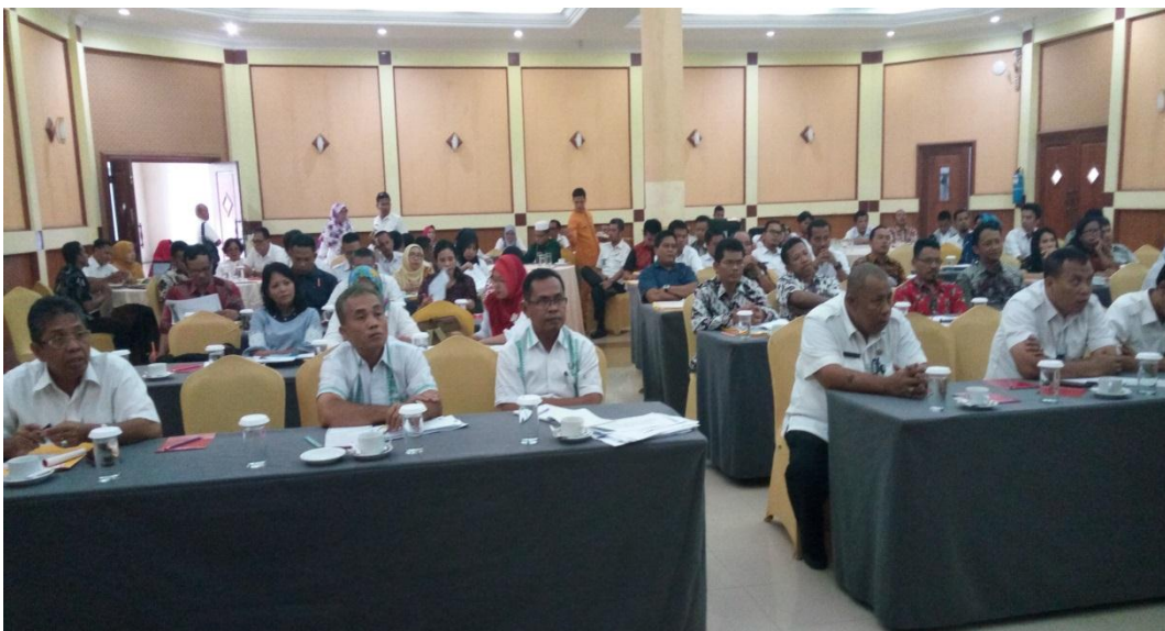
Peserta Forum OPD dengan tekun mendengarkan pengarahan Kepala BDK Provsu