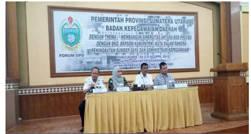
Hari I Nara Sumber terdiri dari : 1. Ketua Komisi A DPRD Provinsi Sumatera Utara; Bappeda Sumatera Utara; Badan Pemberdayaan Sumber Daya Manusia.