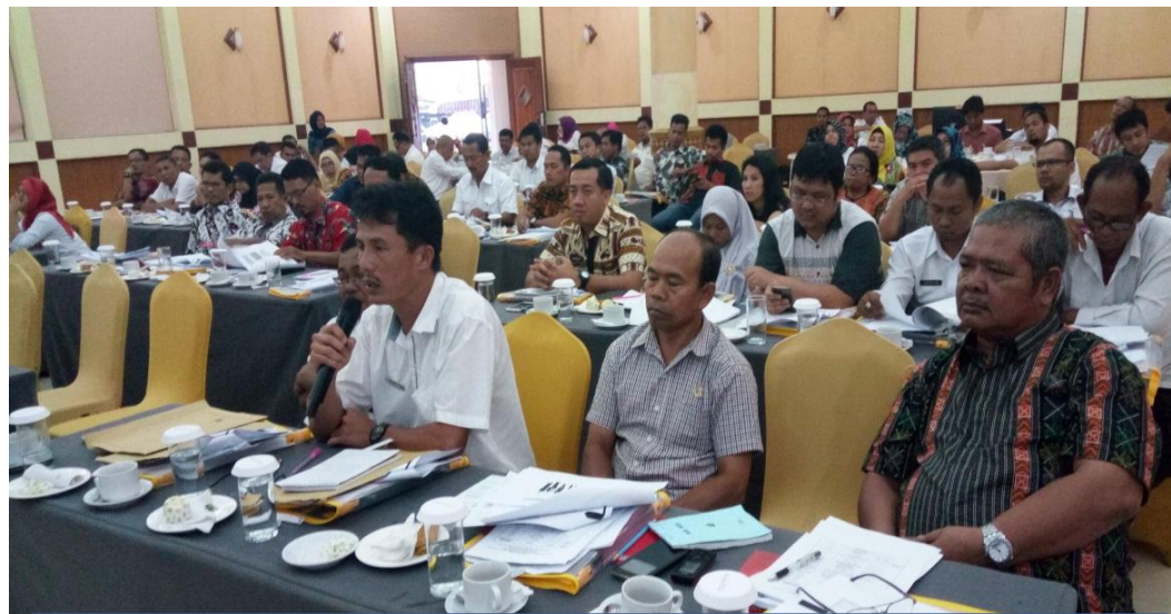
Peserta menyampaikan, pertanyaan, tanggapan dan saran