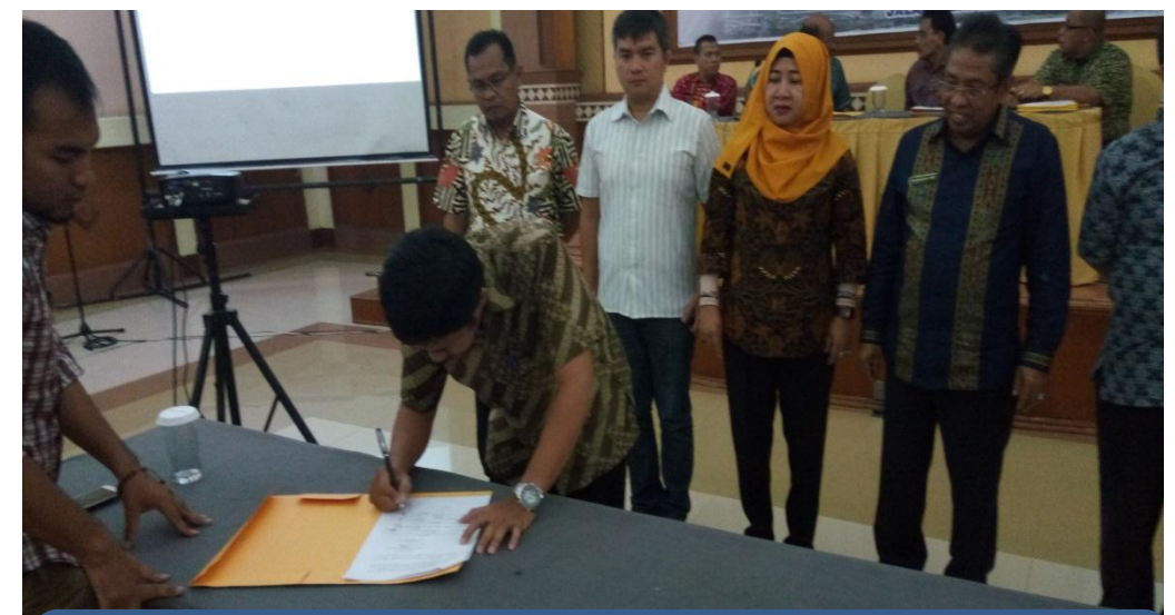
Penandatanganan Berita Acara Hasil Forum OPD BKD Provsu Tahun 2018 oleh Perwakilan dari BKD Kabupaten & Kota se Sumatera Utara