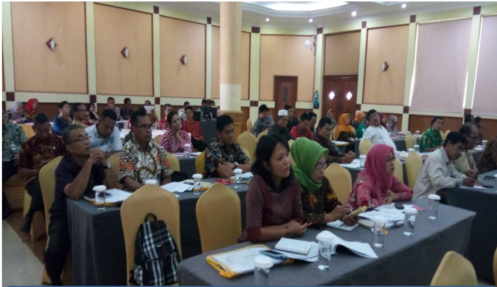
Peserta Forum OPD dengan tekun mendengarkan paparan dari Nara Sumber