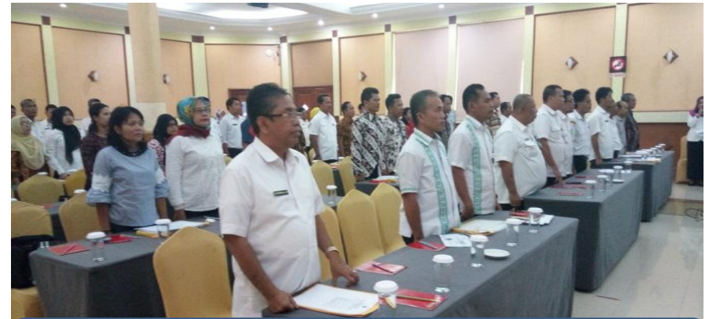
Peserta menyanyikan lagu Indonesia Raya