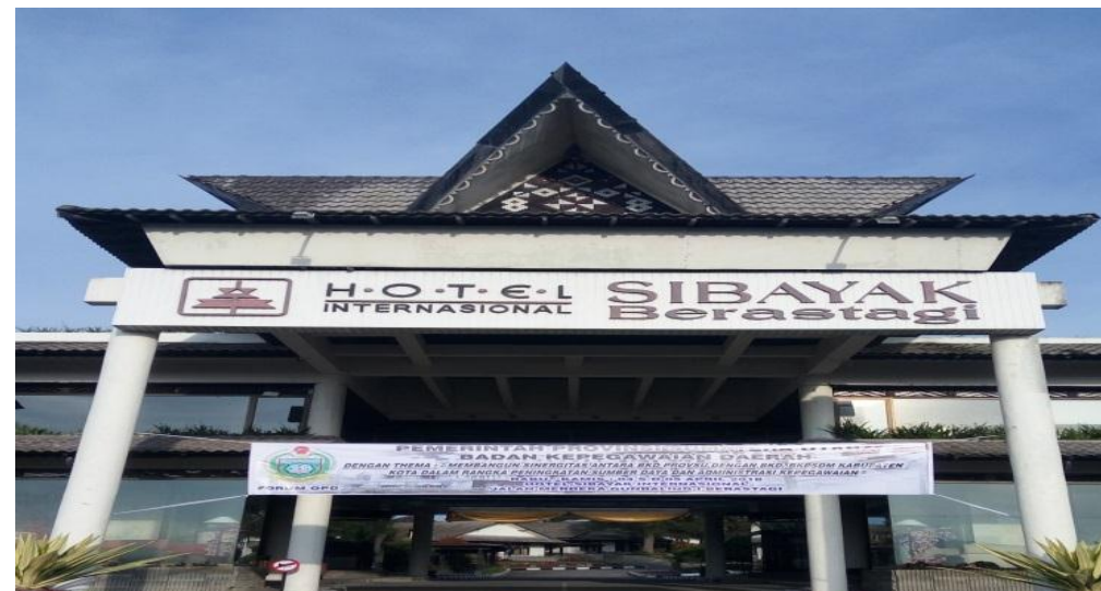
Tempat pelaksanaan kegiatan Forum OPD BKD Provsu tanggal 4-5 April 2018 di Hotel Sibayak Internasional Berastagi Kabupaten Karo.