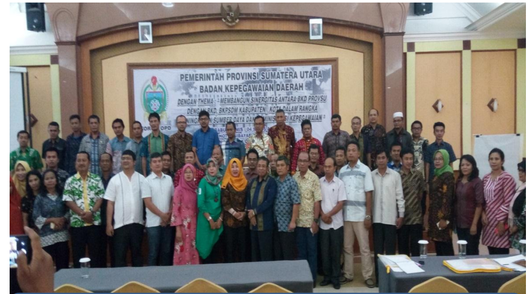
Peserta Forum OPD BKD Provsu foto bersama setelah acara selesai.