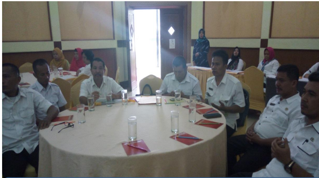
Peserta mengikuti doa.